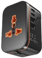
COD.: VCE000544 ADAPTADOR INTER.DE VIAJE 240V 8A NG.EUROAM./ARG./BR. 2USB C +2USB A