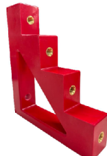
COD.: VCE000489 AISLADOR P/ 4 BARRAS 40MM TIPO ESCALERA - "T" VCP