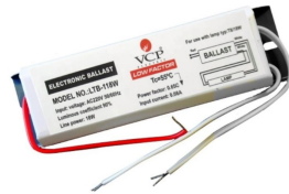
COD.: VC001120 REACTANCIA ELECTRONICA P/ LAMP. FLUOR. 1X20W ARTEF.