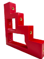
COD.: VCE000490 AISLADOR P/ 4 BARRAS 50MM TIPO ESCALERA - "T" VCP