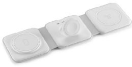
COD.: VCE000527 CARGADOR INALAMBRICO 3 EN 1