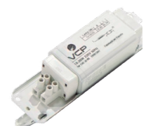
COD.: VC189220 REACTANCIA ELECTRONICA P/ LAMP. FLUOR.20W ARTEF. COD.: VC369240 REACTANCIA ELECTRONICA P/ LAMP. FLUOR.40W ARTEF.