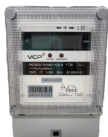
COD.: VCE000457 MEDIDOR DIGITAL MONOFASICO 1P 230V 5-60A LCD.