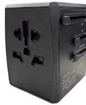
COD.: VCE000542 ADAPTADOR INTER.DE VIAJE 240V 8A NG.EUROAM./ARG./BR. GRANDE+USB