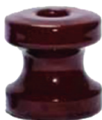
COD.: VC090040 AISLADOR DE PORCELANA ROLDANA 72X72