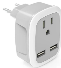
COD.: VCE000545 ADAPTADOR PARA COMPUTADORA 2USB BLANCO