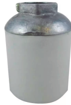
COD.: VC090133 PORTALAMPARA DE PORCELANA E40 5/8"