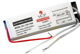
COD.: VCPAF220 REACTANCIA ELECTRONICA P/ LAMP. FLUOR. 2X20W ARTEF.