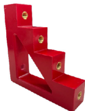
COD.: VCE000488 AISLADOR P/ 4 BARRAS 30MM TIPO ESCALERA - "T" VCP