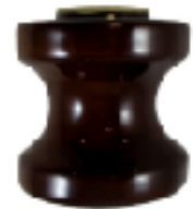
COD.: VC090040 BASE P/FOTO CELULA DE EMBUTIR ANILLO METALICO