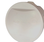
COD.: VC090053 CAJA EXT. PLAST. DE CONEXION 80X50