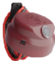
COD.: VC070003 FOTOCELULA C/BASE INCorp. 800W/1200VA 220V (VCPF3C)