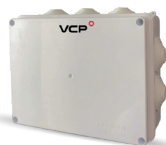
COD.: VC090017 CAJA EXT. PLAST DE CONEXION 200X155X80