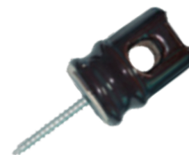
COD.: VC090050 AISLADOR PORCELANA PIMENTON