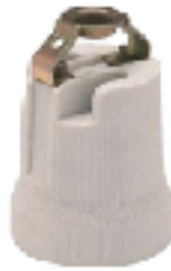
COD.: VC090071 PORTALÁMPARA DE PORCELANA 5/8 E27 CON PUENTE