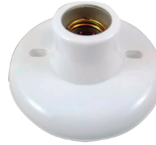
COD.: VC090137 PORTALAMPARA E27