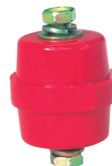
COD.: VC090027 AISLADOR P/BARRA 800A COD.: VC090049 AISLADOR P/ BARRA 1000A