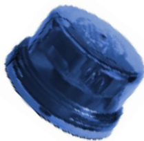
COD.: VC070001 FOTOCELULA LUXON FD POLICARBONATO AZUL 1000W/1800VA 105/ 305V 50-60HZ IP65