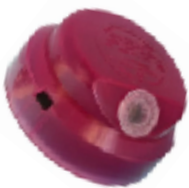
COD.: VC070004Z FOTOCELULA 10A 220V 1000W/ 1800VA