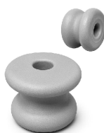
COD.: VC090041 AISLADOR RETENCION 50X60