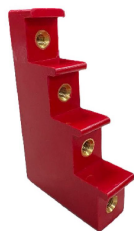
COD.: VCE000487 AISLADOR P/ 4 BARRAS 20MM TIPO ESCALERA - "T" VCP