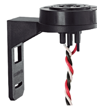
COD.: VC070006 BASE P/FOTOCELULA DE ADOSAR GIRATORIO DE PLÁSTICO