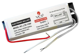
COD.: VCPRE120 REACTANCIA ELECTRONICA. P/LAMP. FLUOR. 1X20W BF 220V50/60HZ