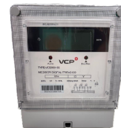
COD.: VCE000458 MEDIDOR DIGITAL TRIFASICO 3P 400V 5-100A 4 WIRE LCD.